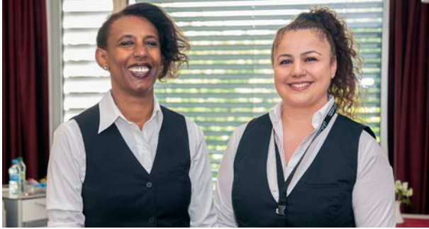
Abbildung: Serviceteam UKB Patientenservice GmbH

Für uns stehen Sie im Mittelpunkt. Wir, als Ihr persönlicher Ansprechpartner, haben uns zur Aufgabe gemacht, Ihren Aufenthalt so angenehm wie möglich zu gestalten, sodass Ihre Genesung bestmöglich voranschreitet.