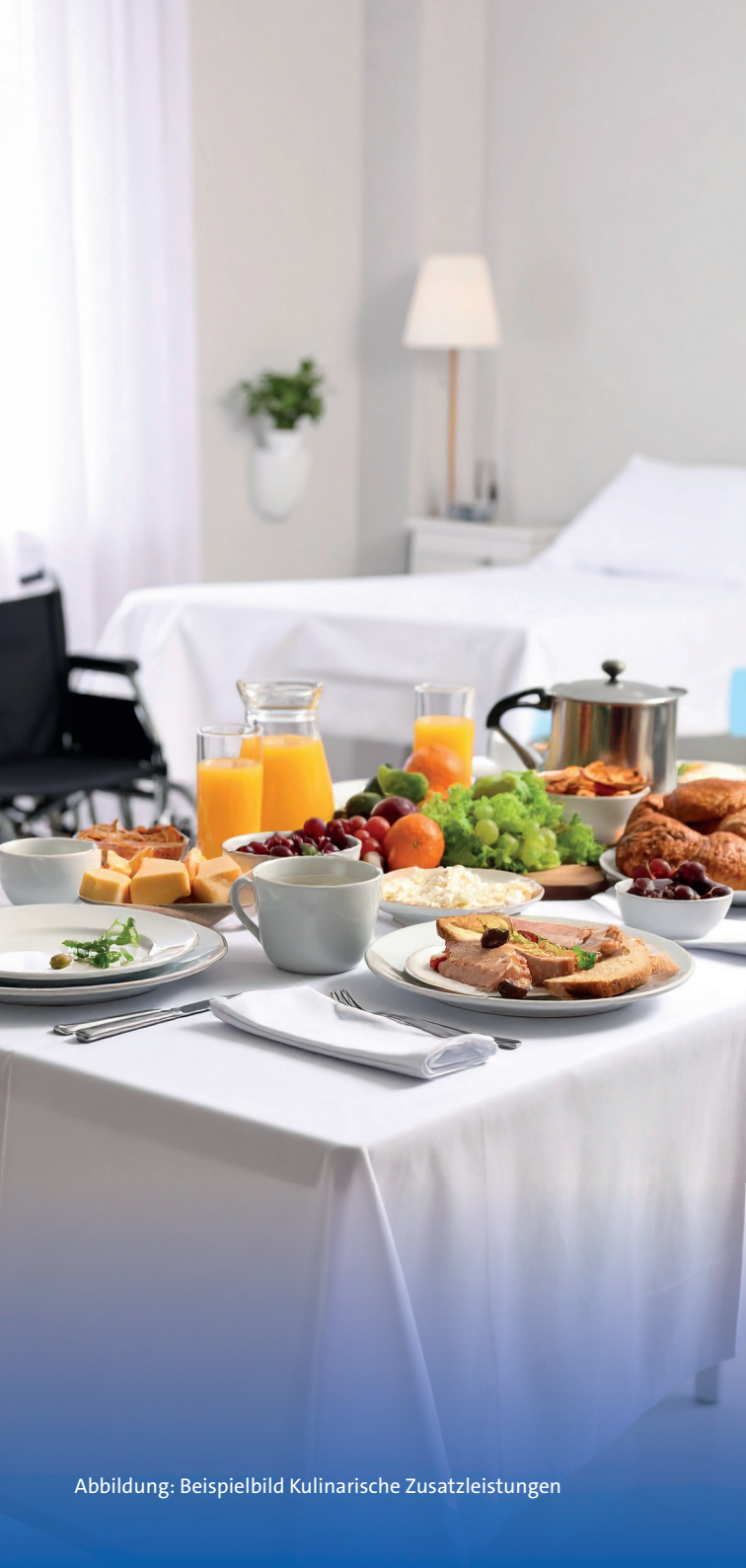
Abbildung: Beispielbild Kulinarische Zusatzleistungen