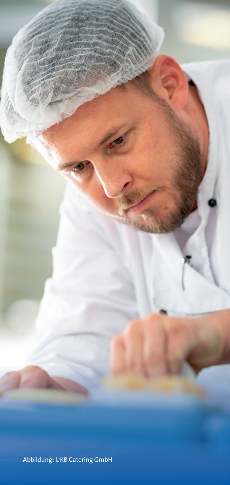
Abbildung: UKB Catering GmbH