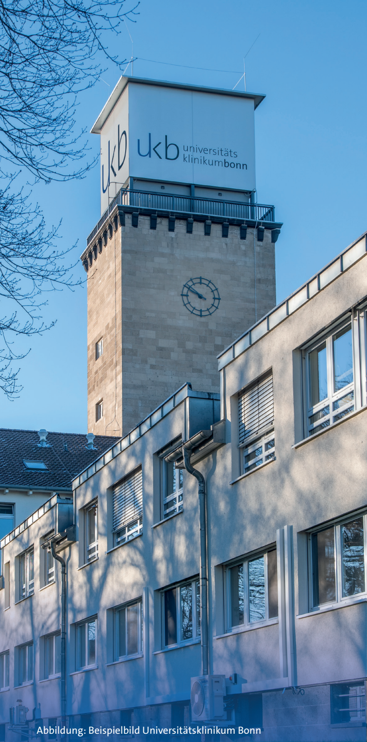
Abbildung: Beispielbild Universitätsklinikum Bonn